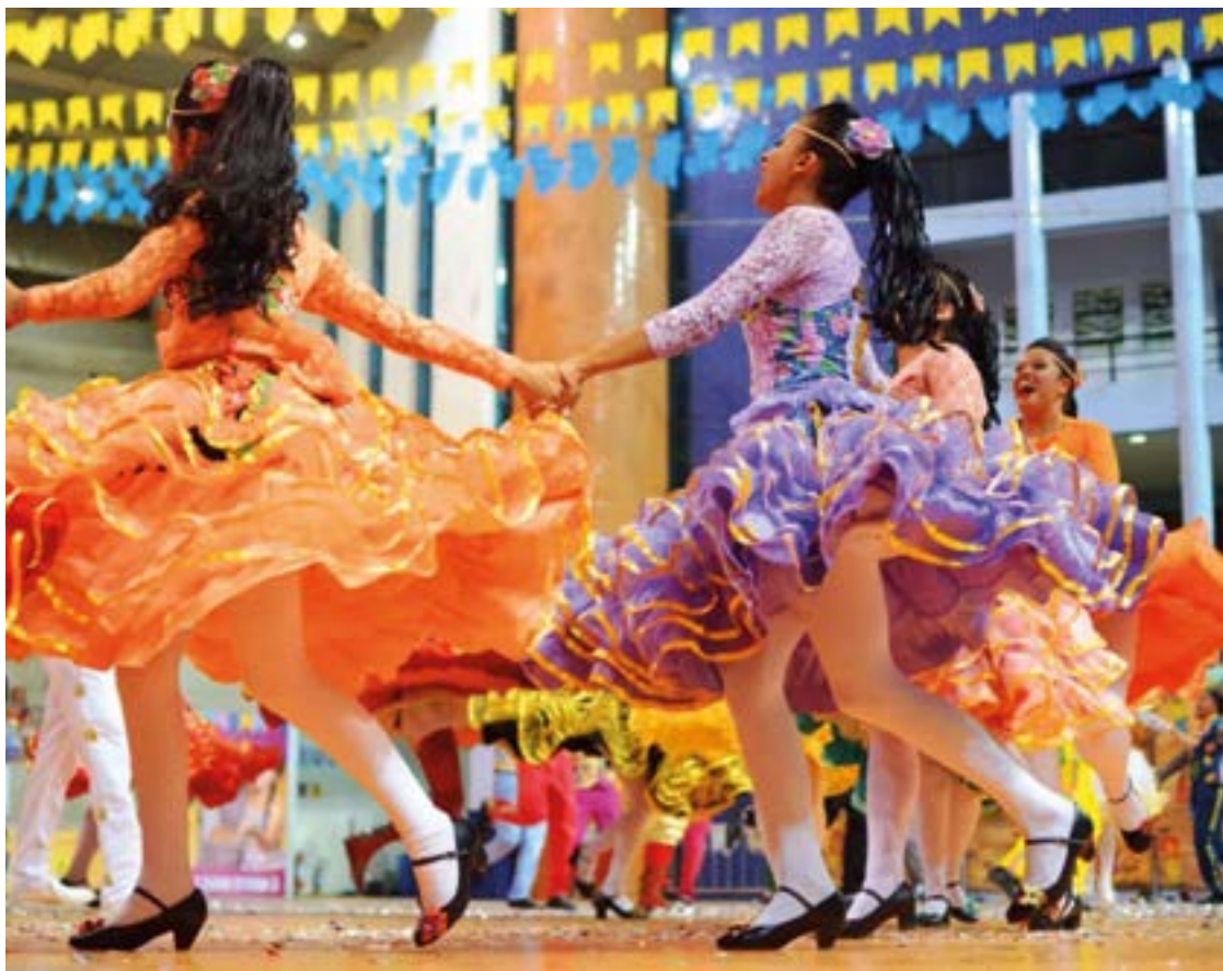
► A Festa Junina de Mossoró está entre as maiores do país

o Forró Caju em Aracaju, uma das maiores festas de Sergipe. Sanfonas, zabumbas e outros instrumentos típicos embalam o forró pé-de-serra, as apresentações folclóricas e as quadrilhas na praça de eventos Hilton Lopes. O evento junino tem até professores de forró para ensinar o ritmo ao público.