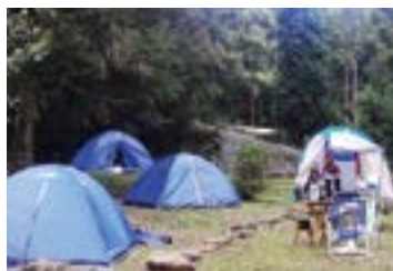
► Camping de Mury

MURY (RJ-08) – Parque Mury/Debossan. Entrada no km 69 da Estrada Rio-Friburgo, à esquerda da “lombada eletrônica”. Tel.: (22) 2542-2275. Instalações-padrão, luz para equipamentos (220v), chuveiros quentes, quadra de esportes, pavilhão de lazer, sauna, piscinas naturais, ducha de rio e play-ground. NÃO TEMPORADA: R$ 17,80 mais equipamento de R$ 2,00 até R$ 34,70; TEMPORADA (16/Dez. a 28/Fev.): R$ 22,60 mais equipamento de R$ 3,30 até R$ 41,80.