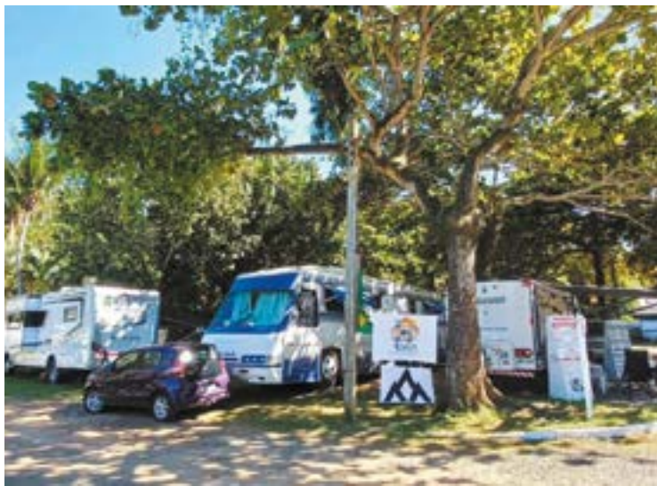
► Trailers e motor-homes compartilharam os espaços disponibilizados no camping