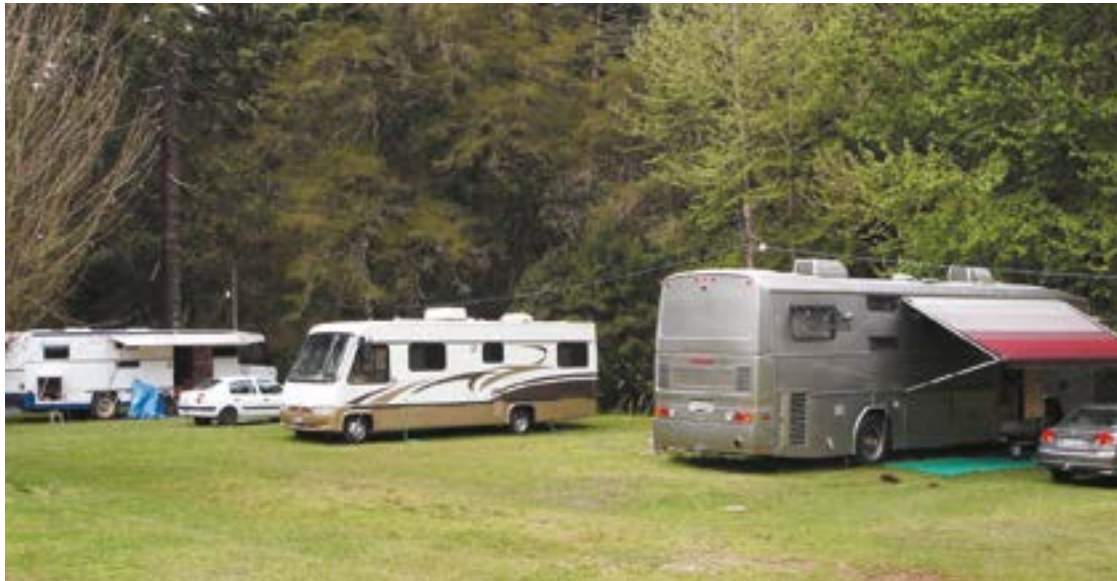
► Para os adeptos do clima frio, o Camping de Campos do Jordão é uma boa opção

Camping – O RN-02 possui instalações-padrão, pavilhão de lazer, luz para equipamentos, chuveiros quentes e quadra de esportes. São 40 mil m² de um espaço