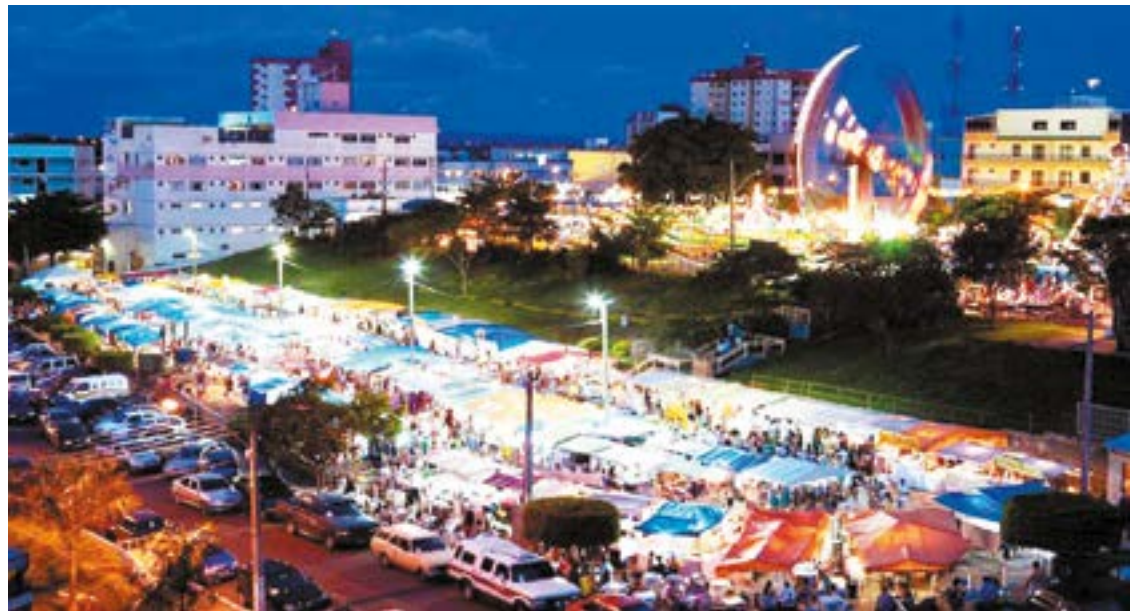
► No centro da cidade, artesanato e gastronomia chamam a atenção dos visitantes