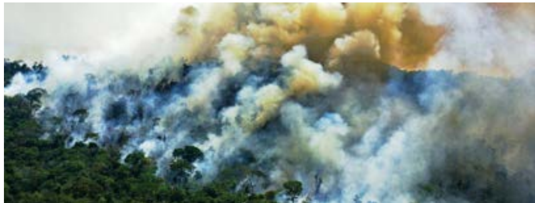
► "Tristeza e ironia. Em Novo Progresso, no Pará, a Floresta Amazônica arde em chamas. Que Novo? Que Progresso?"

Quando se fala em parques nacionais, fica difícil não lembrar da paisagem única e marcante dos Lençóis Maranhenses. Grande parte da sua área (dois terços) é composta por dunas com areia branca e fina, separadas por porções de água em tons de azul e verde, que ajudam a fazer do lugar um verdadeiro paraíso. Com 155 mil hectares, está localizado na região noroeste do Maranhão, na cidade de Barreirinhas, a 250km da capital, São Luís. Faz parte do bioma do Cerrado, mas com influência também da Caatinga e da Amazônia. Para visitar, vale escolher uma data na alta temporada, entre abril até agosto, após as épocas de chuvas. Já entre outubro e dezembro, as lagoas secam e a paisagem se transforma em um imenso deserto.