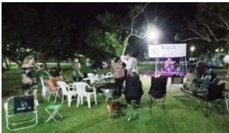
► No sábado à noite, um show de voz e violão congregou todos os participantes do Encontro

presença e o forte sentimento de confraternização dos companheiros do Grupo durante os três dias do evento, a solidariedade manifestada pelas doações de gêneros alimentícios, entregues à Creche Alegria e o empenho observado dos funcionários do camping na logística de localização dos equipamentos e na conservação das unidades de atendimento aos campistas.