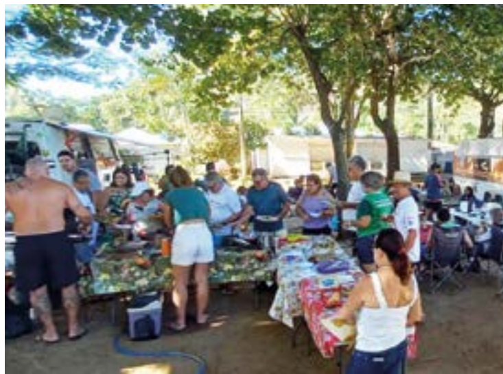
► As reuniões de “junta pratos” movimentaram as tardes, à sombra das amendoeiras