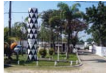
► Camping de Ubatuba

CLUBE DOS 500 (SP-01) – km 60/SP da Via Dutra, Guaratinguetá (SP). Tel.: (12) 3122-4175. Instalações-padrão, luz para equipamentos (220v), chuveiros quentes, pavilhão de lazer, quadras de esportes, piscinas cloradas e play-ground. NÃO TEMPORADA: R$ 18,60 mais equipamento de R$ 2,00 até R$ 35,80; TEMPORADA (16/Dez. a 28/Fev.): R$ 19,40 mais equipamento de R$ 3,30 até R$ 37,40.