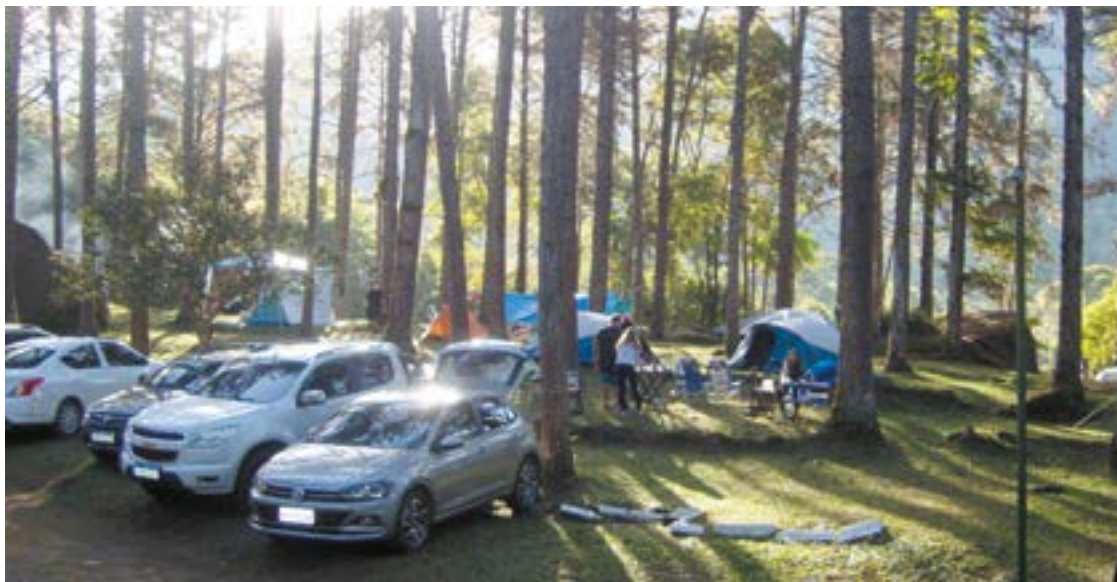
► O Camping da Serrinha retoma neste mês as Noites de Queijos e Vinhos