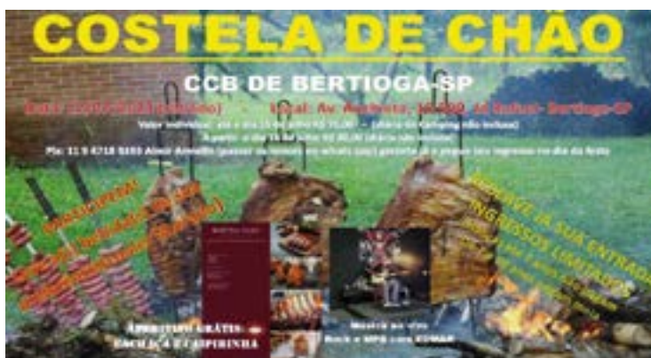
► Em Bertioga, a Costela de Chão

Em Ubatuba, a Festa da Tainha na Brasa, antes programada para julho, será realizada em 23 de setembro próximo.