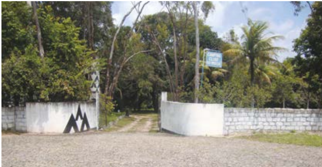
► A 25 km de Natal, pela BR-101, o Camping de Lagoa do Bonfim