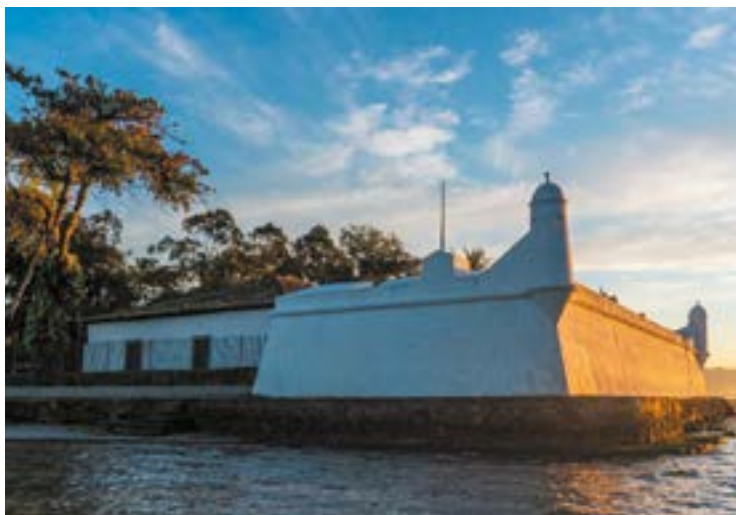
► Uma das atrações históricas de Bertiooga, o Forte São João

FORTE SÃO JOÃO - Não é por que você está à beira-mar que não pode aprender um pouco sobre a história do destino. O Forte São João foi construído em 1560. Era uma proteção para acessar o Rio